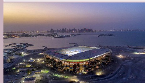
Ras Abu Aboud