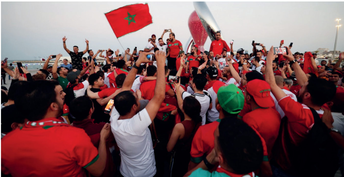
Des supporters marocains rassemblés près de l'horloge du compte à rebours de la Coupe du monde à Doha le 14 novembre dernier, avant la Coupe du monde de football Qatar 2022

• Trois joueurs du Wydad dans la liste de la sélection marocaine