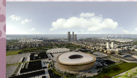
La Cité de l'éducation