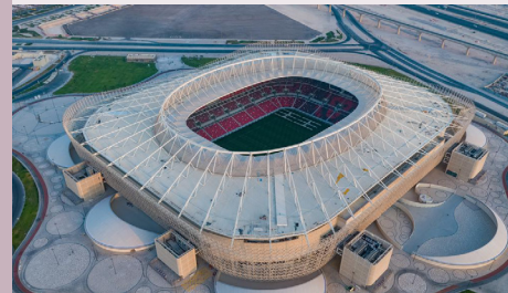
Ahmed bin Ali