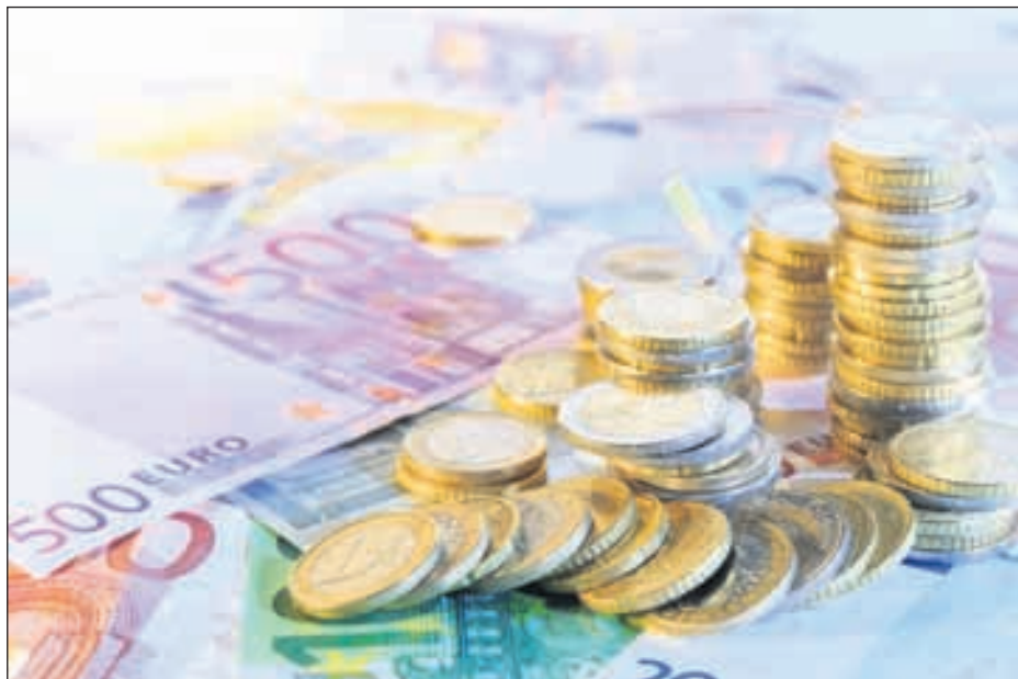
En vertu de la convention OCDE sur l'échange automatique de l'information à des fins fiscales, à laquelle le Maroc a adhéré, le secret bancaire a vécu

C' EST officiel: pas de prolongation pour le dispositif de la contribution libératoire. Lors de la réunion qu'il a tenue, mercredi 8 octobre, avec les présidents de banques, le gouverneur de Bank Al-Maghrib, le directeur général des Impôts et le directeur de l'Office des changes, Mohamed Boussaïd, ministre des Finances, a officiellement confirmé que l'amnistie ne sera pas reconduite l'année prochaine. Par conséquent, les contribuables qui n'auront pas souscrit au dispositif d'ici le 31 décembre 2014 se verront appliquer le droit commun. L'information coïncide avec la préparation du projet de loi de Finances 2015.