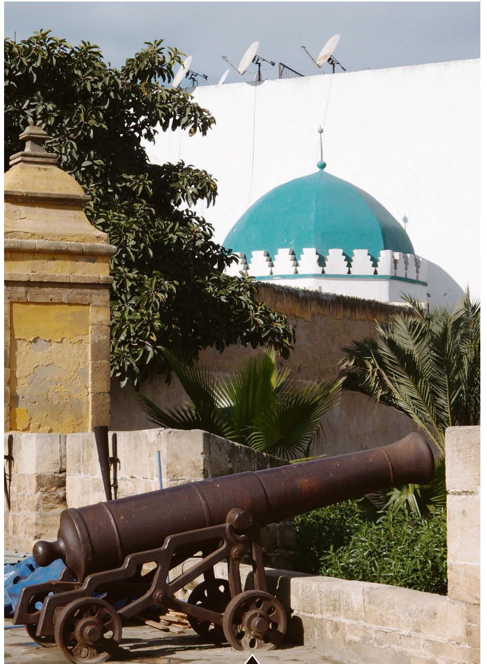
Départ du circuit Ancienne médina: Le Bastion de la Sqala. Sa construction a été décidée par le sultan Sidi Mohamed Ben Abdellah vers 1770, grand bâtisseur des défenses maritimes (Tanger, Essaouira, Rabat...). Elle servait à résister aux attaques des Européens qui longeaient la côte marocaine