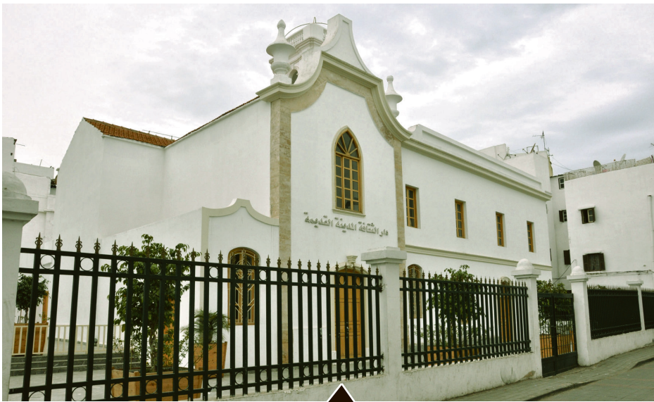
Le sultan Moulay Hassan Ier décida d'attribuer gracieusement au roi d'Espagne le terrain de la rue de Tanger. C'est là que, en 1891, fut élevée l'église San Buenaventura des franciscains. L'église a fait l'objet en août 2010 d'un projet de réhabilitation en Maison de la culture

L'un des rendez-vous culturels incontournables de Casablanca est de retour pour une 7 e édition qui se tiendra jusqu'au 22 avril, avec comme invité d'honneur la ville de Ramallah, qui mettra également son patrimoine à l'honneur. Comme chaque année, des conférences, des expositions et des animations artistiques sont au programme, sans oublier les visites guidées qui seront accompagnées de 200 guides-médiateurs bénévoles. Plus de 5.000 scolaires sont attendus aujourd'hui pour cette journée qui leur est dédiée. Le grand public est invité à visiter ou revisiter la ville blanche les 18 et 19 avril de 10h à 17h. Il suffit de se présenter à l'heure aux départs d'un circuit ( www.journeesdupatrimoine.ma ). Parmi les circuits prévus: l'Ancienne médina, Boulevard Mohammed V, le quartier des Habous, la ville de Mohammedia, et le quartier Hay Mohammadi et Roches Noires (circuit en bus).