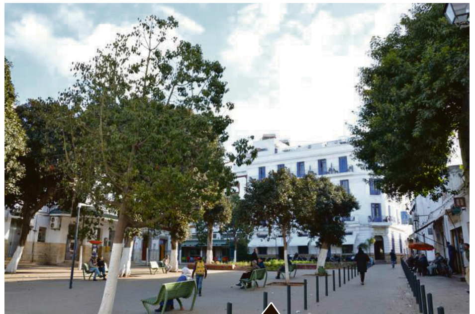
Anciennement connue sous le nom de «Philibert», la place Ahmed El Bidaoui a été créée au début des années 1920, à l'angle de la rue du Port et de la rue d'Anfa. Sa construction a entraîné la démolition de plusieurs entrepôts destinés aux marchandises du port. La place accueille encore aujourd'hui l'hôtel Central et la Porte de la Marine, "Bab el marsa", qui était, jusqu'au début du XX e siècle, la seule porte d'entrée dans la ville par la mer