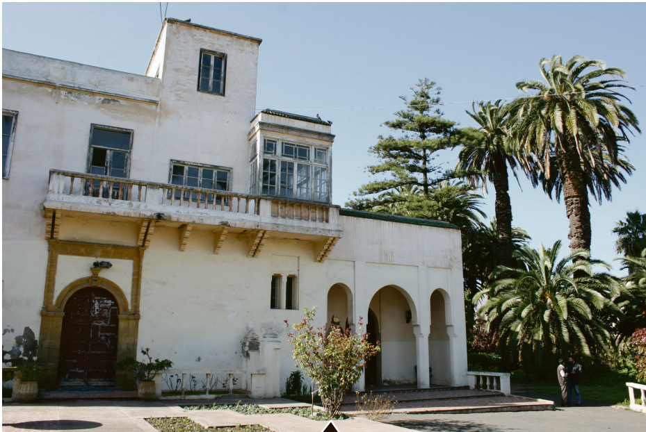
La Maison de l'Union est un édifice qui servait de maison d'hôtes pour la Résidence. Après l'indépendance, le Roi Mohammed V en fit don à l'UMT, centrale syndicale de l'Union marocaine du travail, en reconnaissance des actions de Résistance de la force ouvrière