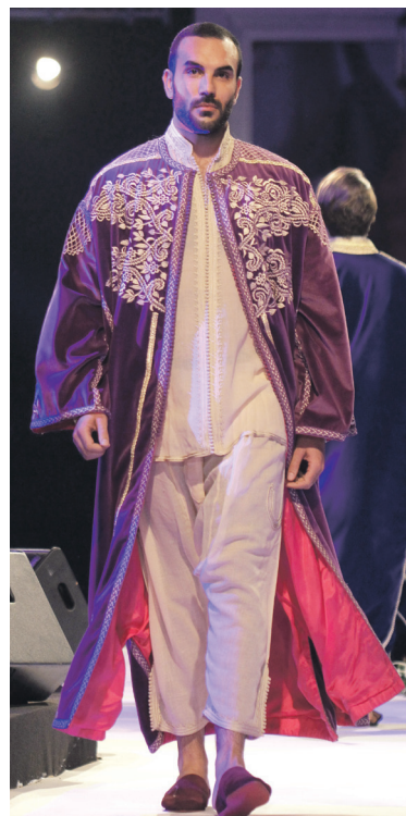
Inspiré des contes des Mille et une nuits, ce caftan pour homme est conçu par Samira Haddouchi