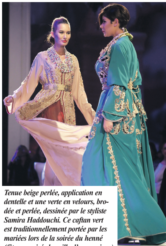
Tenue beige perlée, application en dentelle et une verte en velours, brodée et perlée, dessinée par le styliste Samira Haddouchi. Ce caftan vert est traditionnellement portée par les mariées lors de la soirée du henné (fête organisée la veille d'un mariage)