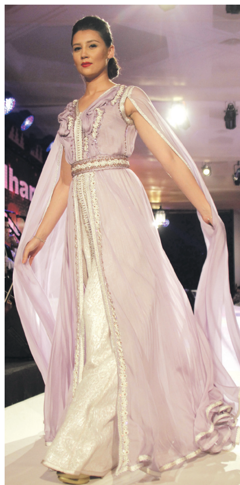
Tenue en mousseline plissé, dessinée par Abdelhanin Rouah, sur un brocard de soie, ton sur ton, broderie de maâlem, avec perlage pour le ton